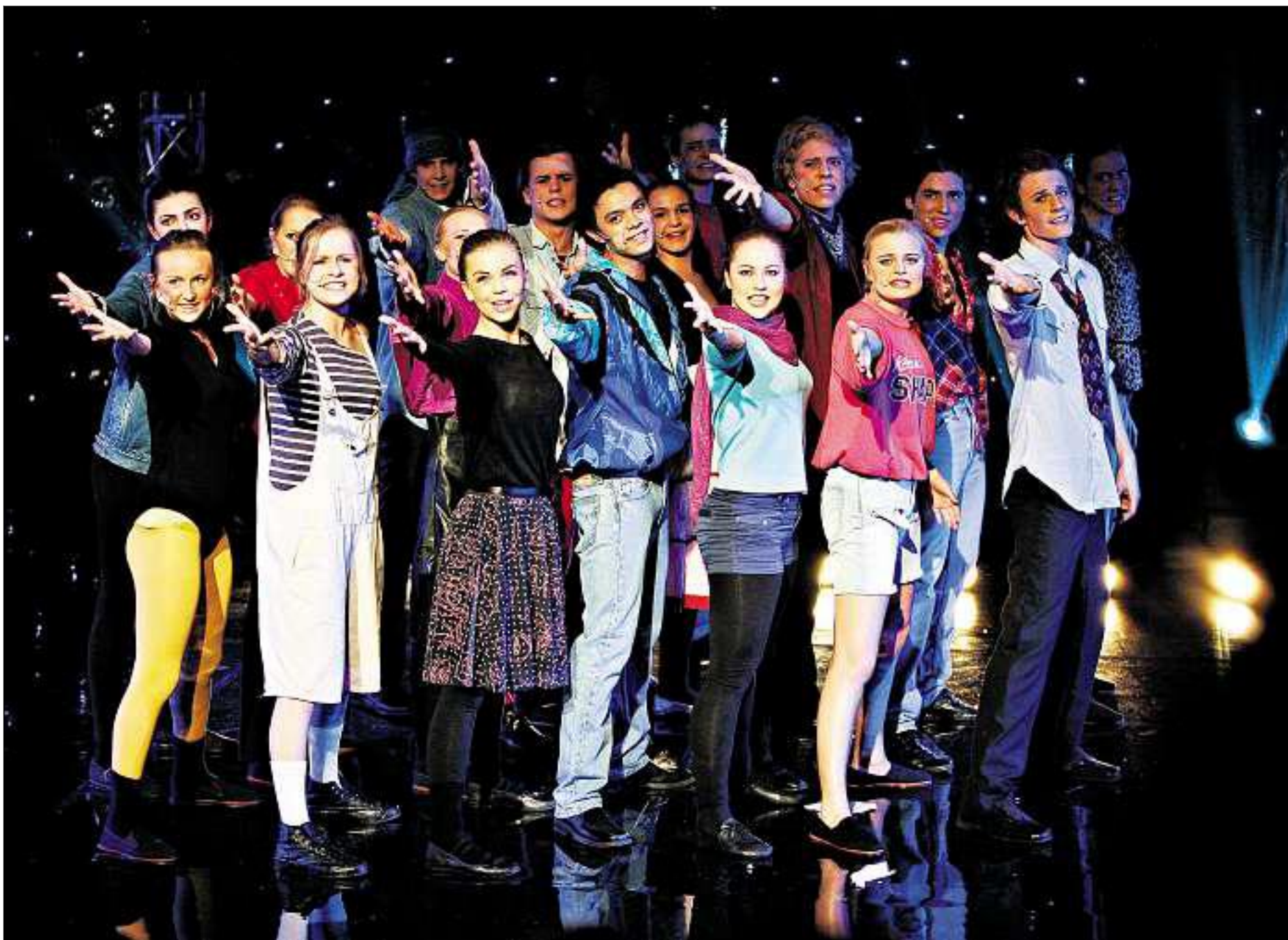
Elvebakkenelevne imponerer i «History», etterfølgeren til fjorårets revyprisvinner.